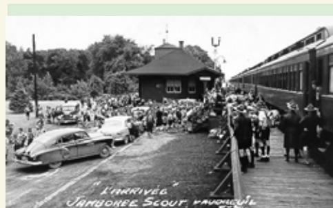
C'est du 20 au 28 août 1951 que s'est tenu le deuxième Jamboree de la Fédération Des Scouts Catholiques

En août 1937 eut lieu [sous le thème « Source et Rayonnement »], le premier jamboree de la Fédération à l'Île-Sainte-Hélène qui a réuni 1 500 participants. Également en 1937 eut lieu le premier camp de formation pour l'obtention du Badge de Bois sous la direction d'Henry Dhavernas, chef scout français diplômé de Gilwell Park.