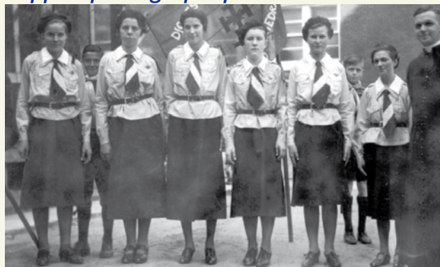
Promesse guide à Saint-Hyacinthe en 1938.