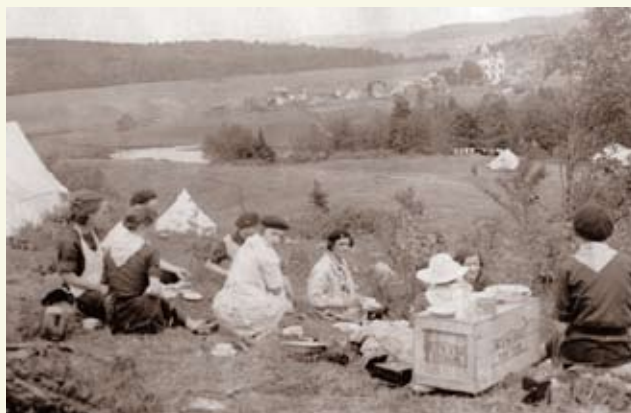
Camp guide au mont Saint-Hilaire en 1939, au loin, vue du village de Saint-Mathias.