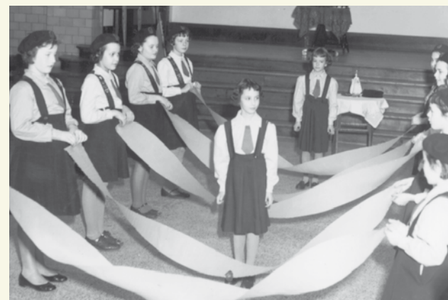
Les Jeannettes en 1967.