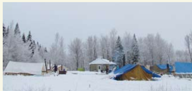
Oui ! Les scouts campent même en hiver en 2014.