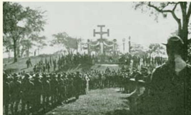
La grand-messe fut célébrée par Son Éminence le cardinal Rodrigue Villeneuve, archevêque de Québec et primate de l'Église canadienne.

En janvier 1936, le Conseil provincial adopta les « Statuts et règlements ». Le 12 novembre 1936, la Fédération obtint une charte provinciale.